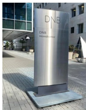
I september 2022 ble første bedriftsgruppe i finansområdet etablert.

Vår og høst 2022 er det etablert fire nye bedriftsgrupper og bidratt til valg av tillitsvalgte i flere virksomheter. Vi har blant annet fått etablert vår første bedriftsgruppe på finansområdet, i DNB Bank. I finansområdet har Juristforbundet i dag over 400 medlemmer. Medlemsmassen er voksende og rådgiver i sekretariatet er nå i prosess med mål om å etablere en Hovedavtale/Overenskomst.